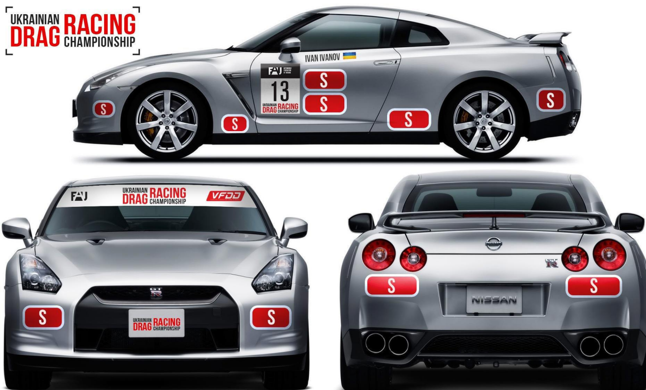
Наклейка на лобове скло.

За порушення цієї вимоги Представник пеналізується грошовим штрафом, розмір якого повинен бути вказаний в Індивідуальному Регламенті змагання. Але такий штраф не може перевищувати розмір Заявочного внеску до відповідного класу (у випадку, коли заявочні внески відсутні – відповідно до стандартного внеску), у якому допущено даний автомобіль.